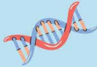
Sejarah keluarga yang pernah mempunyai kanser payudara

Ketumbuhan sel payudara - biasa dan tidak biasa - adalah disebabkan perubahan estrogen. Tahap hormon estrogen yang tinggi disebabkan keadaan dibawah: