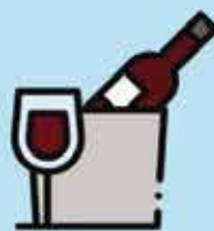
Minum alkohol berlebihan