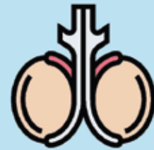
Testicular disease or surgery