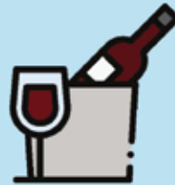
Heavy use of alcohol