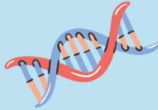
Family history of breast cancer

Breast cell growth - normal and abnormal - is stimulated by the presence of estrogen. Men can have high estrogen levels as a result of the conditions below.