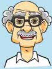
Umur yang meningkat